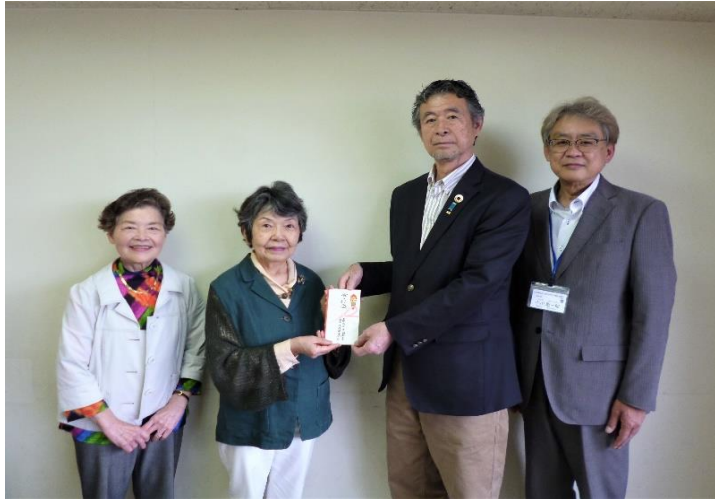
【国際ソロプチミスト国分寺 様】