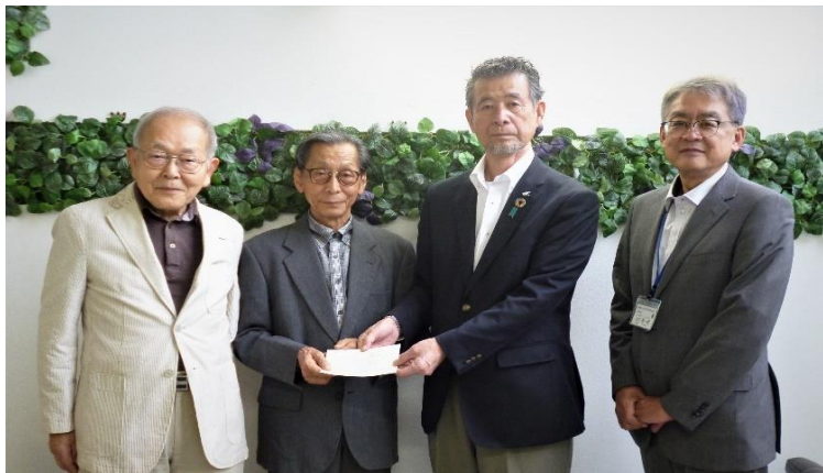
【ひだまりふれあいチャリティコンサート実行委員会 様】