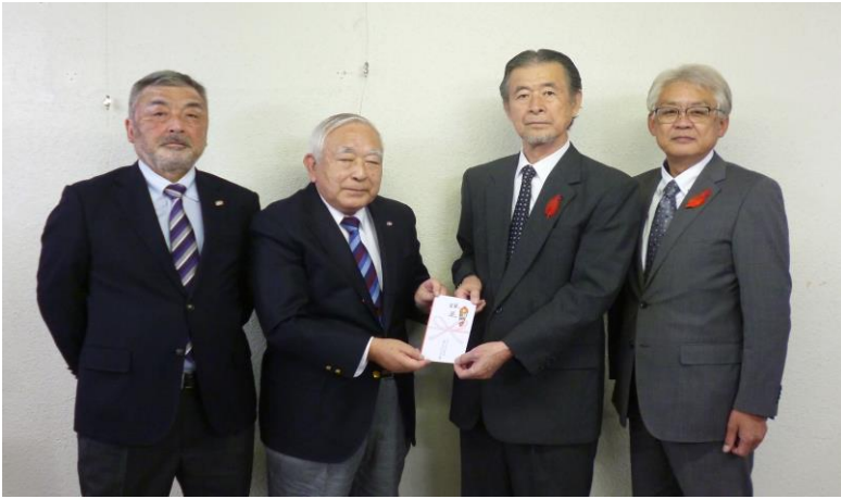
【中央大学学員会 国分寺白門会支部 様】