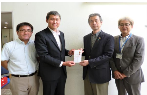
【ルネサスグループ労働組合連合会 本社・武蔵地区支部 様】